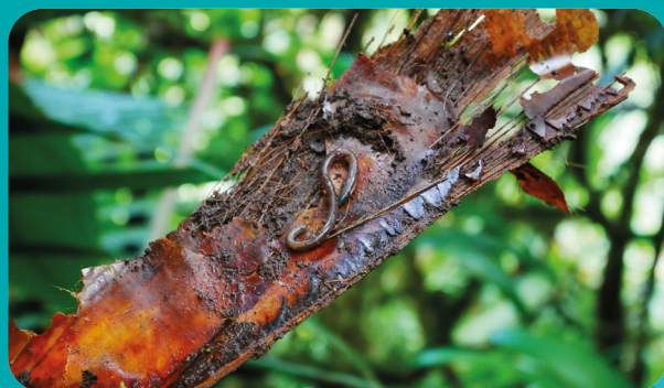
Ver arboricole collecté à l'aisselle d'une feuille de palmier

Pour en savoir plus sur les vers de la Martinique et sur l'étude du Cirad, RDV sur le site internet de l'OMB.